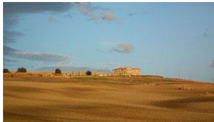
Un suggestivo scorcio della Val d'Orcia, una delle zone in cui si tiene il Festival Aurora 2013

Al via la seconda edizione di "Aurora", dal 5 al 7 luglio, a Pienza e Monticchiello (Siena), l'appuntamento interdisciplinare nel cuore della Val d'Orcia, che nel primo fine settimana di luglio trasforma il suggestivo scenario di Pienza e dintorni in piattaforma di scambio e approfondimento sul rapporto con Natura e ambiente